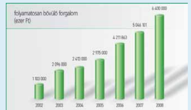
A VER-BAU hazai forgalma előzetes 2008-as adatok alapján

külséri beton felületek készítését végző, modern gépsor még az elmúlt év végén megérkezett hozzánk. Ez az új berendezés jelenleg a Ferihegy T2 termináljánál, mintegy 76 ezer négyzetmétert lát el bazaltbeton burkolattal. Úgy gondolom, hogy ez a döntés is hozzájárulhat a térben terén elért piacvezető pozíciónk megőrzéséhez. Ugyan-