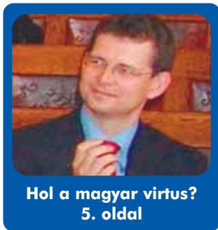
Hol a magyar virtus? 5. oldal