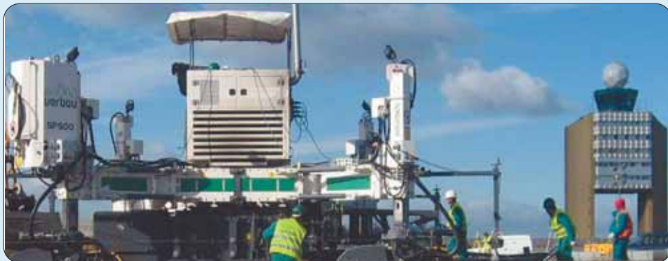
Az új beton finisszerrel jelenleg a Ferihegy T2 termináljánál dolgoznak a kecskeméti cég szakemberei

– Vezetőként az embernek nyilvánvalóan több lehetséges forgatókönyvre is fel kell készülnie, melyek között vannak rosszabbak is. Hinnie azonban, csak az optimista változatban szabad. A VER-BAU ma a modern kor elvárásainak is megfelelő technológiai és informatikai háttérrel rendelkezik. Szakembereink nem csupán a hazai, de európai szinten is bizonyítottak és büszkén állíthatom, hogy bárhol megállják a helyüket. Az idei évre már most csaknem négymilliárd forint összegű szerződésállományunk van különböző projektekre. Úgy gondolom, hogy ezek alapján, optimistán várhatunk neki az előttünk álló, egyszerűnek éppen nem mondható időszaknak. De feltehetjük magunknak a kérdést: melyik időszak egyszerű?