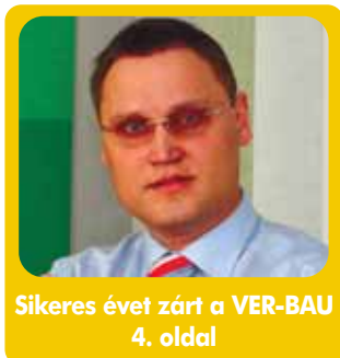
Sikeres évet zárt a VER-BAU 4. oldal