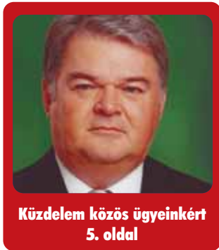
Küzdalem közös ügyeinkért 5. oldal