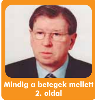
Mindig a betegek mellett 2. oldal